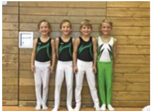
und der Bayerischen Schülermannschaftsmeisterschaft