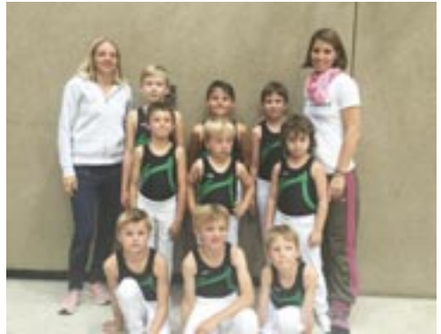
Die erfolgreichen Teilnehmer der Gaumeisterschaft

Glückwunsch an die erfolgreichen Nachwuchssportler und herzlichen Dank an das neu formierte Trainerteam – macht weiter so!!!