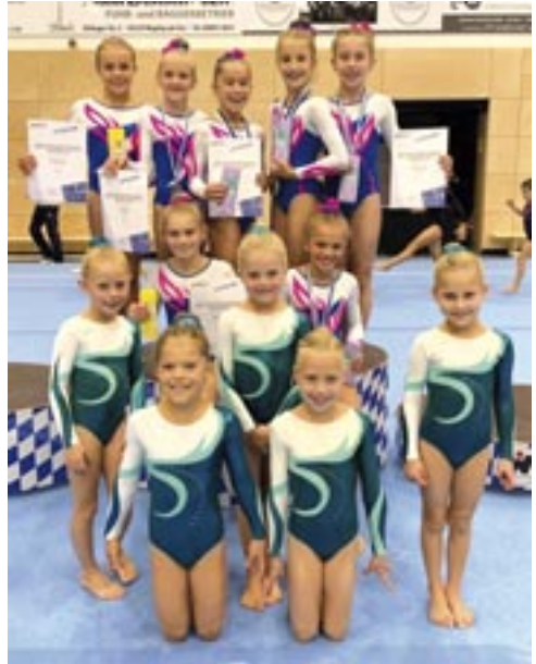
Jetzendorfer Turnerinnen der AK6-12

Ebenso gingen in der Altersklasse 9 die Plätze eins