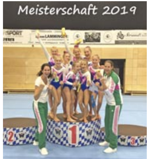
Meistermannschaft und Trainerinnen

Dabei sah es zu Beginn des Wettkampfes nicht danach aus, dass eine Titelverteidigung möglich ist. Im Vorfeld gab es zwei Verletzungsbedingte Aus-