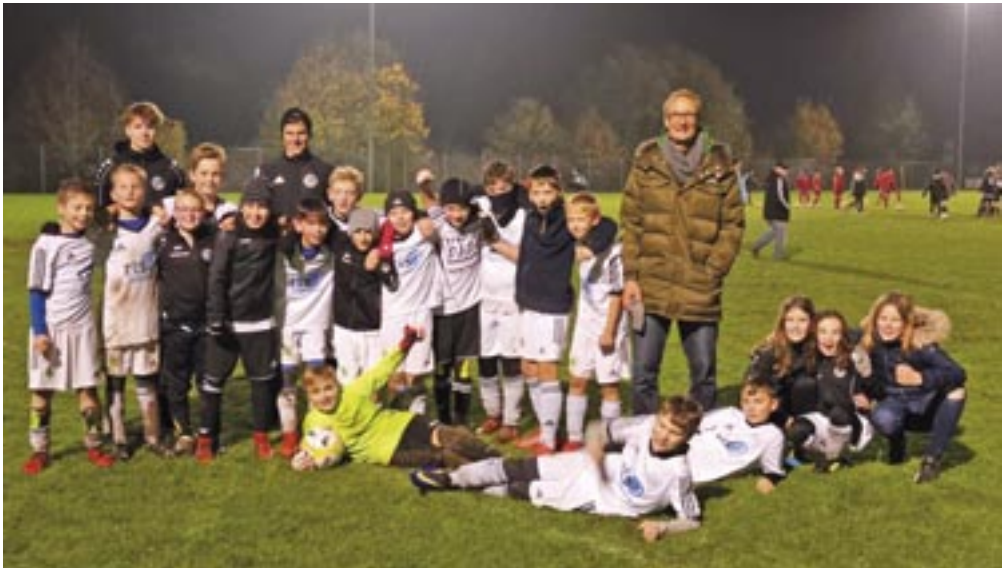
U 13 (D-Jugend) Gruppe 3 PAF, Stand 17.11.2019

Durch die starke E-Jugendtrainerarbeit in der Saison davor, vom TSV und dem FC, ist das Team in der Lage jede der 9 Mannschftspositionen mit einem Top Spieler zu besetzen. Einige Positionen sogar doppelt. Somit fällt es dem Trainerstab leichter auch neue Spieler, oder Spieler mit weniger Spielstärke in das Team zu integrieren. Die Spieler lernen am