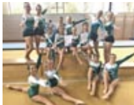
Tolle Stimmung bei den kleinen und großen Turnerinnen