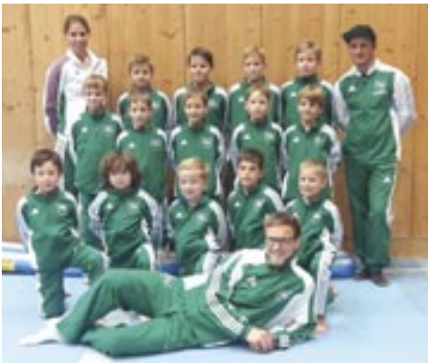
Kleider machen Leute

Älteren waren teilweise terminlich verhindert, so dass die Mannschaft sich dem Wettkampf leider nicht stellen konnte. So mussten also die Jüngeren die TSV-Fahne hochhalten, was ihnen mit einem guten dritten Platz aber in hervorragender Weise gelungen ist. Ganz nach vorne reichte es leider nicht, da sich die Riege aus Gaimersheim und vor allem die Turner aus Landau an diesem Tag absolut keine Blöße gaben.