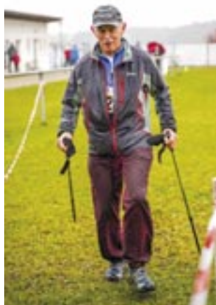
Ältester Teilnehmer „Hery“ D.

Ebenfalls flott unterwegs waren die Staffelläufer vom TSV Jahn Freising. Die 1. Staffel kam nach 20:58 Minuten noch vor dem schnellsten Einzelläufer ins Ziel. Gut 2 Minuten später folgte die 2. Staffel der Freisinger. Platz 3 belegte die Familienstaffel Keil.