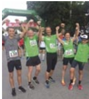
Die strahlenden Läufer

Bei knapp 20 Grad und Sonne fand der diesjährige Straßenlauf in Indersdorf statt. Mit insgesamt 331 Teilnehmern, verteilt auf die verschiedenen Distanzen; Schülerläufe, Nordic Walking, Hobbylauf und der Hauptlauf über 10 km, wieder ein voller Erfolg. Auch einige Jetzendorfer starteten bei perfektem Laufwetter und Volksfeststim-