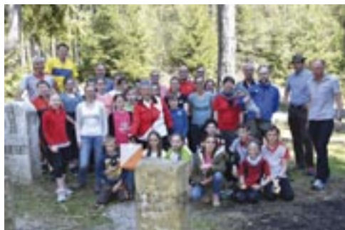
Grenzgänger aus Jetzendorf und Coburg – Gemeinsames Orientierungslauf-Trainingslager bei Selb

Unsere aktive OL-Gruppe trifft sich einmal pro Woche. Im Sommer immer am Abend jeden Dienstag oder Donnerstag und jetzt im Winter am Samstag-Nachmittag. Wundern braucht man sich jedoch nicht, wenn man uns kaum sieht ... denn unser Stadion ist die Natur und so versuchen wir rund um Jetzendorf und Petershausen möglichst viel Abwechslung zu schaffen und treffen uns immer woanders. Regelmäßig dabei sind derzeit viele Kinder