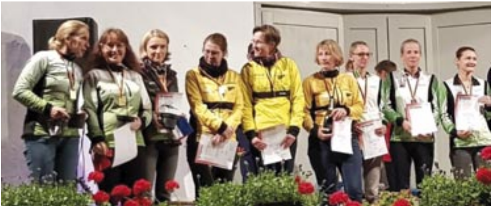
Erfolgreiches Damen Team des TSV

drohte wegen Krankheit am Ende noch zu platzen. Zum Glück spielte uns das neue DTB Startrecht in die Karten und so konnten wir kurzfristig eine Läuferin aus einem anderen oberbayerischen Verein für uns verpflichten. Dass sich die lange Fahrt bis in den Harz für den TSV gelohnt hat, zeigten am Ende die überzeugenden Ergebnisse: